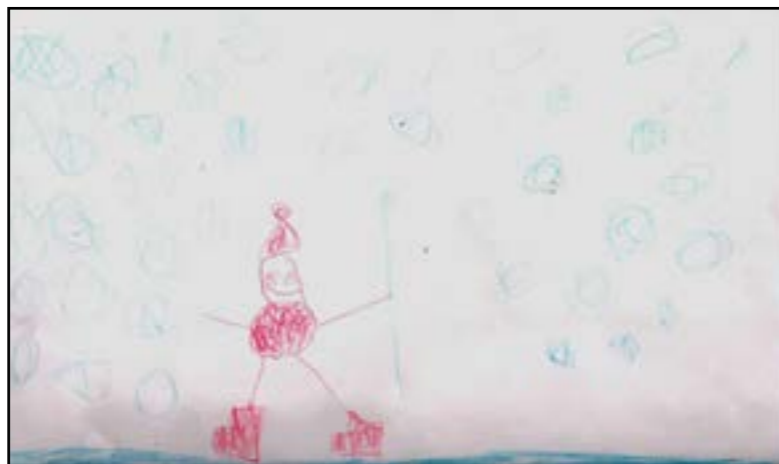
Якушин Сева, 5 лет